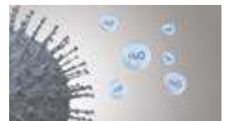
Aktiviteten til forurensende stoffer hemmes.