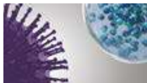
nanoe™ X fanger forurensning.

Egenskapene til nanoe™ X sørger for at flere typer forurensning kan deaktiveres, for eksempel bakterier, virus, mugg, allergener, pollen og noen skadelige stoffer.