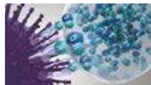
Hydroksylradikaler denaturerer proteinene i forurensende stoffer.